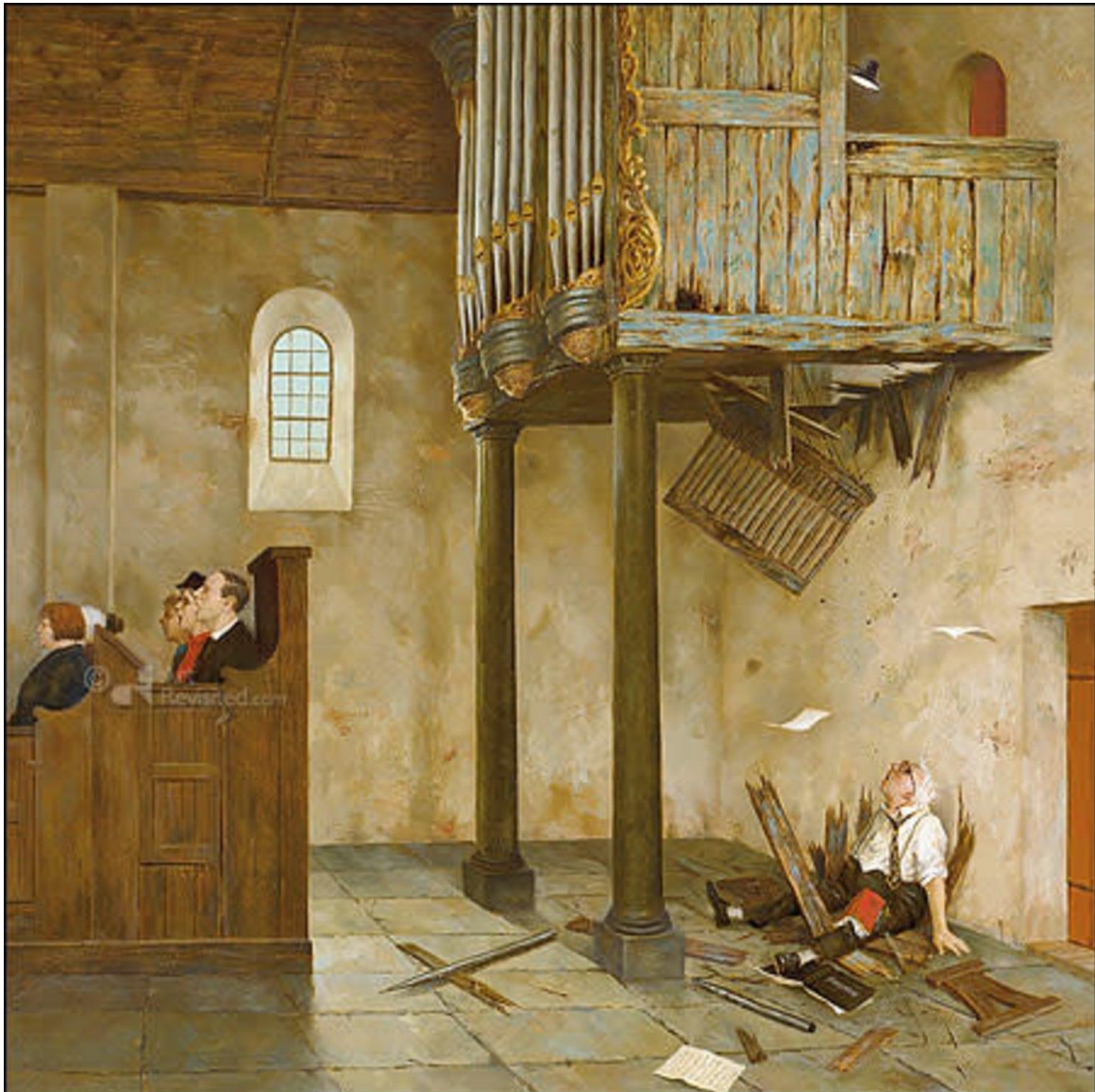
A Capella. Schilderij van Marius van Dokkum

We zingen lied 657: 1 t/m 4 - Zolang wij ademhalen.