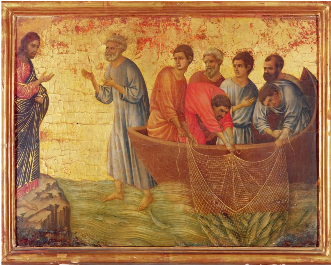
Jezus bij het meer van Tiberias, Duccio di Buoninsegna (ca. 1310)