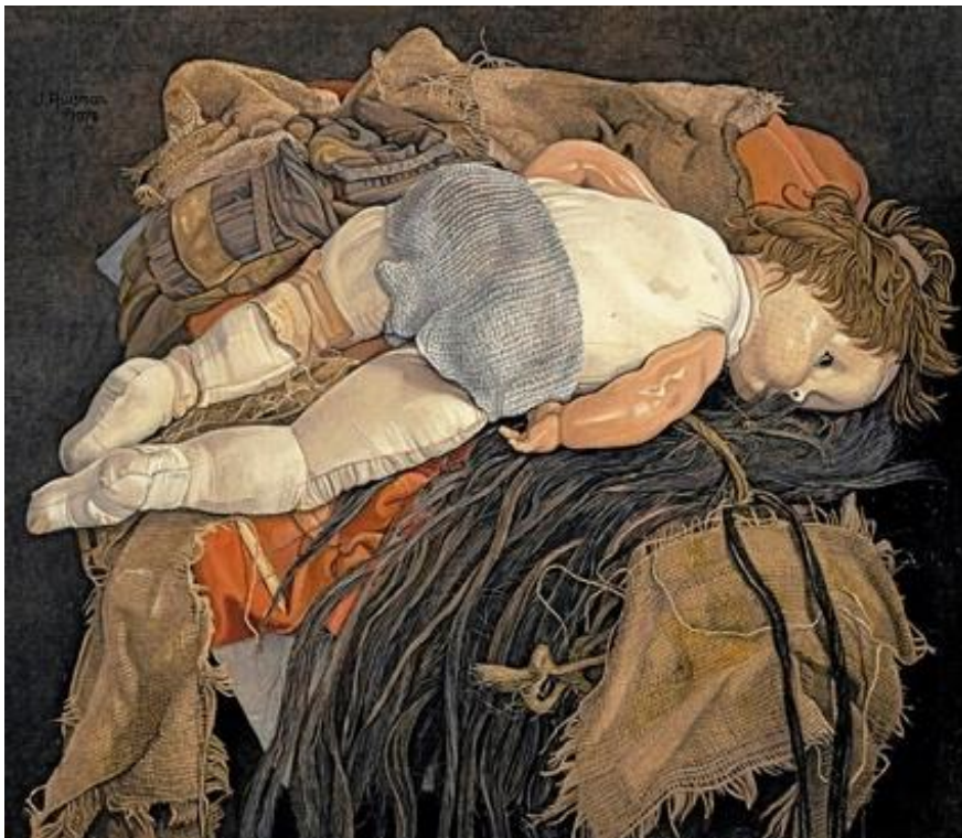
Beeld: Jopie Huismans, Weggeworpen lappenpop