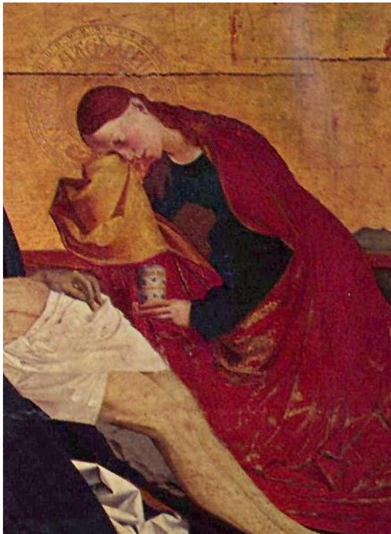
Enguerrand Quarton, (Detail: Maria Magdalena naast het lichaam van Jezus, uit) La Pietà de Villeneuve lès Avignon (ca. 1455)

Protestantse Gemeente te Schoorl-Groet-Camp